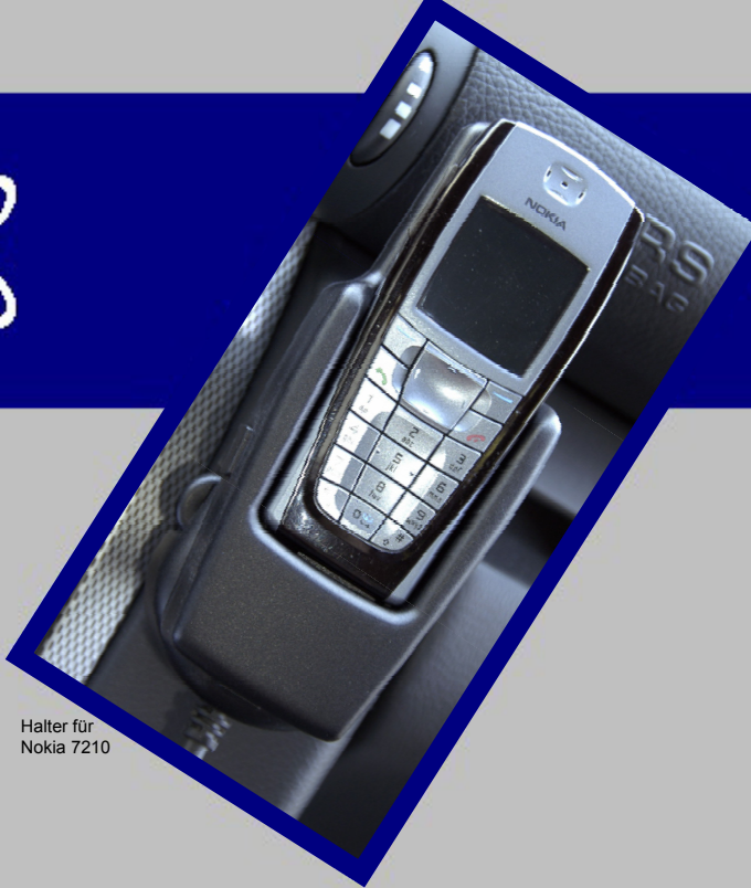
Halter für Nokia 7210